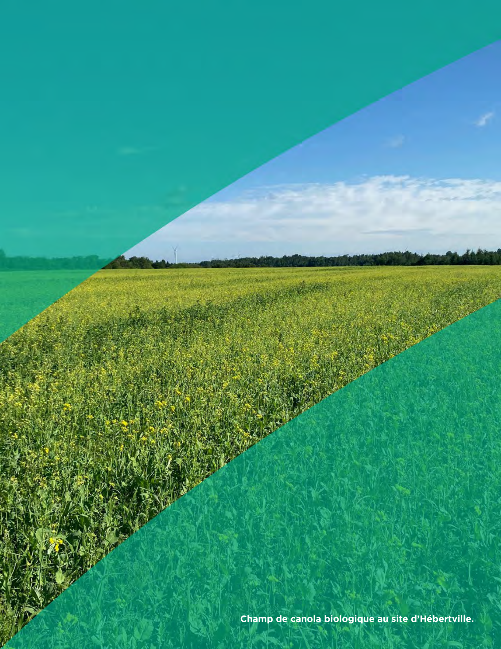
Champ de canola biologique au site d'Hébertville.