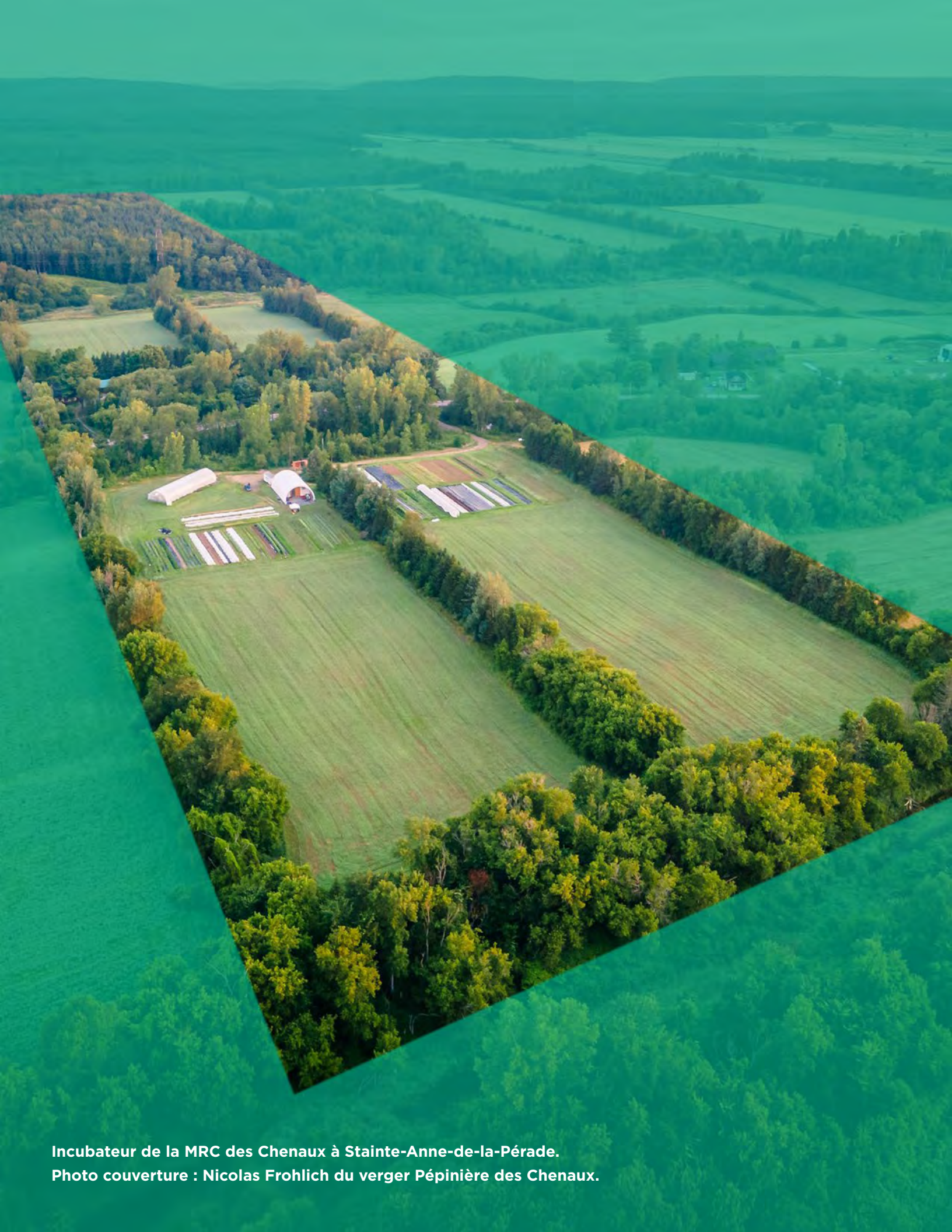
Incubateur de la MRC des Chenaux à Sainte-Anne-de-la-Pérade. Photo couverture : Nicolas Frohlich du verger Pépinière des Chenaux.