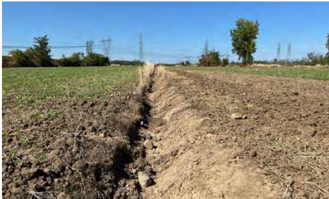
Construction d'un pont à Sainte-Anne-de-la-Pérade, réfection d'un chemin à Beauharnois, et refaçonnage d'un fossé à Brossard, sont des exemples de travaux d'intendance de terres agricoles.