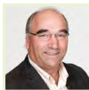
Pierre Lemieux Fiduciaire