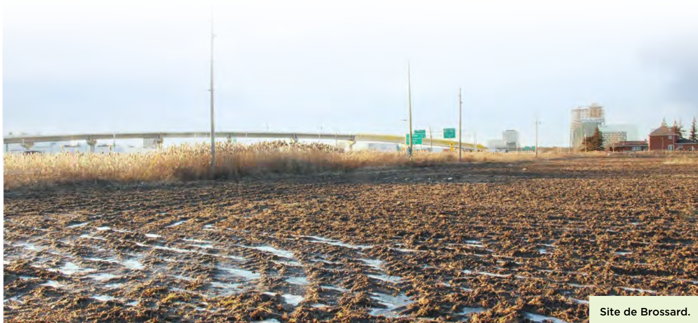
Site de Brossard.